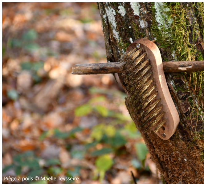
Piège à poils